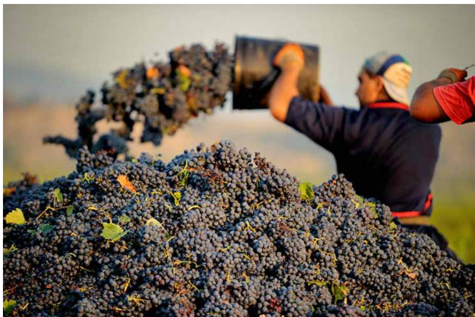
Berba grožđa, 13. jul-Plantaze, Podgorica

preispituje po isteku deset godina od njegovog donošenja, odnosno preispitivanja i kao takav obezbjeđuje jedinstvenost vodnog prostora na nivou Crne Gore. Zakonom o vodama („Sl.list RCG“, br.27/07) uređen je pravni status i način integralnog upravljanja vodama, vodnim i priobalnim zemljištem i vodnim objektima, uslovi i način obavljanja vodne djelatnosti i druga pitanja od značaja za upravljanje vodama i vodnim dobrom. Zakonom o finansiranju upravljanja vodama („Službeni list Crne Gore“, br. 65/08) utvrđena je visina i način obračunavanja vodnih naknada i kriterijumima i načinu utvrđivanja stepena zagađenosti voda („Službeni list Crne Gore“, br. 29/09).