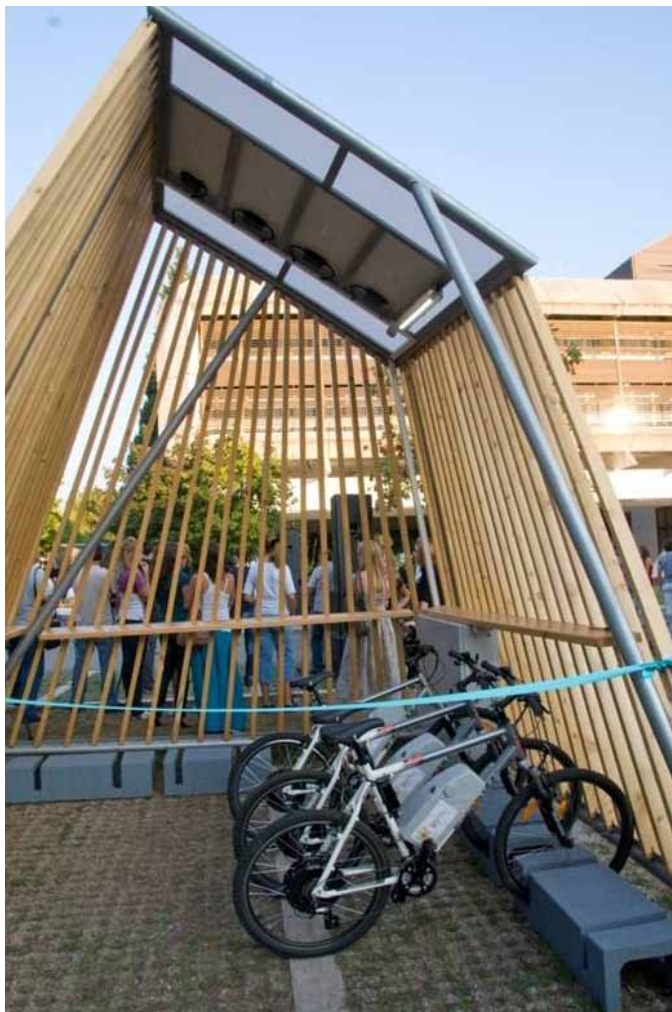
Stanica za električna bicikla na solarno napajanje, Podgorica

Sektor za preduzetništvo i industriju ima za zadatak da u narednom periodu promoviše razvoj „zelene ekonomije“. Ovaj sektor je prepoznao potrebu informisanja o CIP programu u kojem se nalazi i takmičenje za Eko-inovacije. Radi se o programu Zajed-