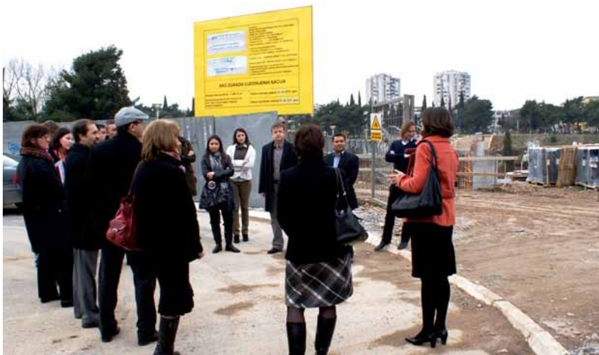
Početak radova na izgradnji ekološke zgrade Ujedinjenih nacija u Podgorici, prvog takvog objekta UN-a u svijetu

Crna Gora razvija saradnju na multilateralnoj i na bilateralnoj osnovi sa brojnim partnerima. Preko svojih diplomatsko-kon-