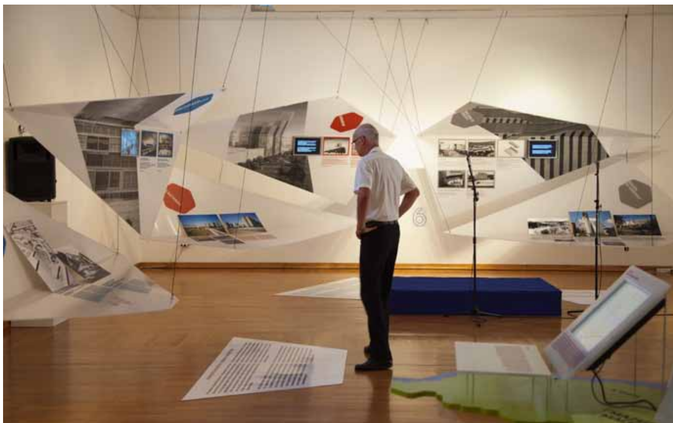
Otvaranje izložbe „Balkanologija – nova arhitektura i urbani fenomeni u Jugoistočnoj Evropi,“ Podgorica

U sferi umjetnosti, održivi razvoj prepoznat je u oblasti kreativnih industrija, koja svojom kompleksnošću stvara uslove za izražavanje različitih pristupa ovom principu i njegovoj upotrebi. Pravilnom primjenom održivog razvoja u umjetnosti, ili u kulturi uopšte, obezbjeđuje se solventnost, isplativost kulture, stvaraju se nova radna mjesta i kreira komercijalna vrijednost kulturnog proizvoda. Ministarstvo kulture godišnjim konkursima podržava projekte zasnovane na principu održivog razvoja, a oni se uglavnom odnose na manifestacije i festivale, tradicionalne zanate i vještine, te kreativne industrije.